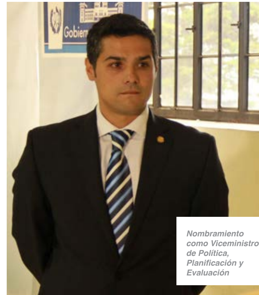
Nombramiento como Viceministro de Política, Planificación y Evaluación

"Las Capacidades del Viceministro dan para mucho más y tomamos la decisión de que fuera él, el que hiciera las evaluaciones...y la planificación, haciendo un cambio estratégico dentro del Ministerio"