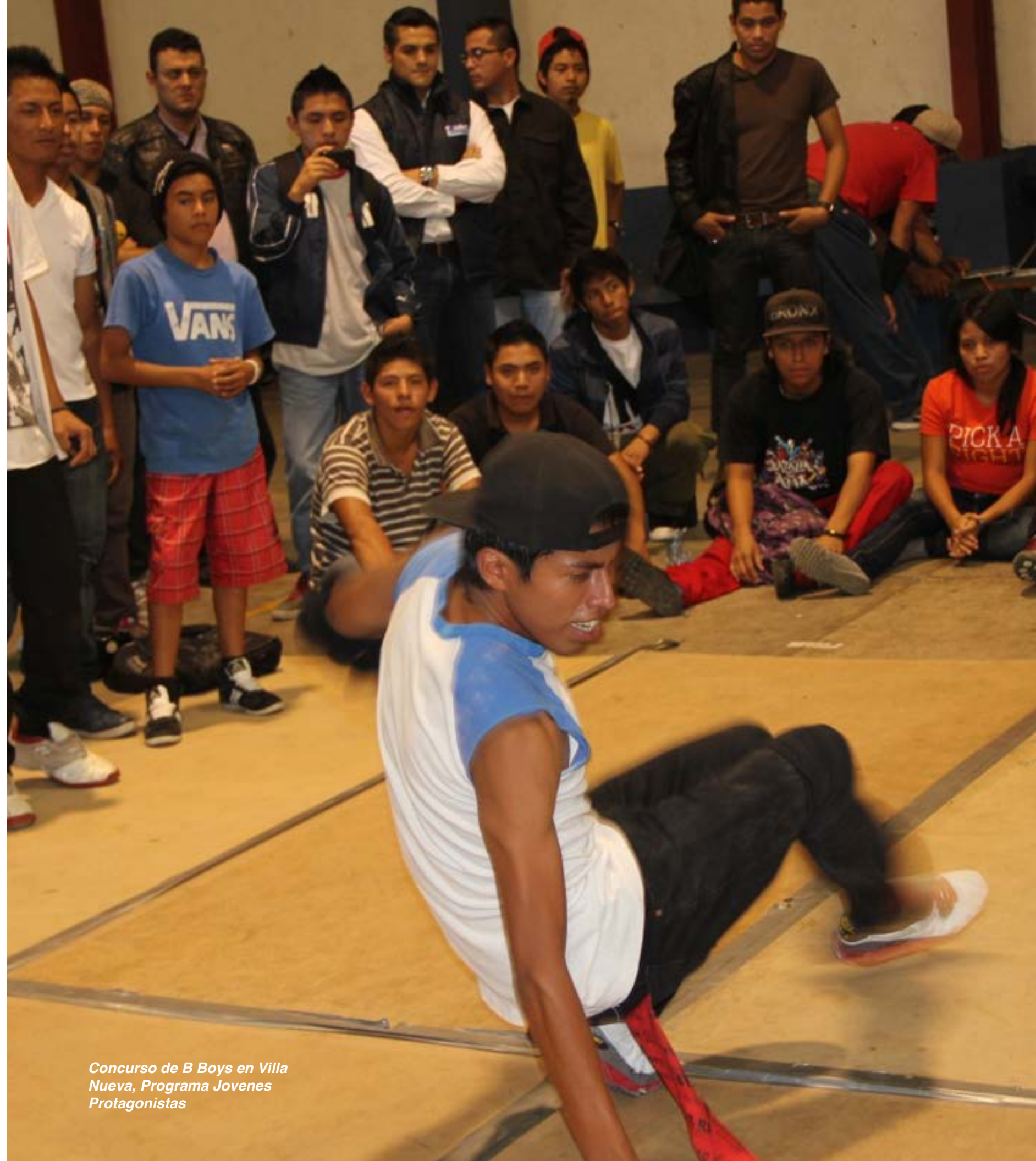
Concurso de B Boys en Villa Nueva, Programa Jovenes Protagonistas