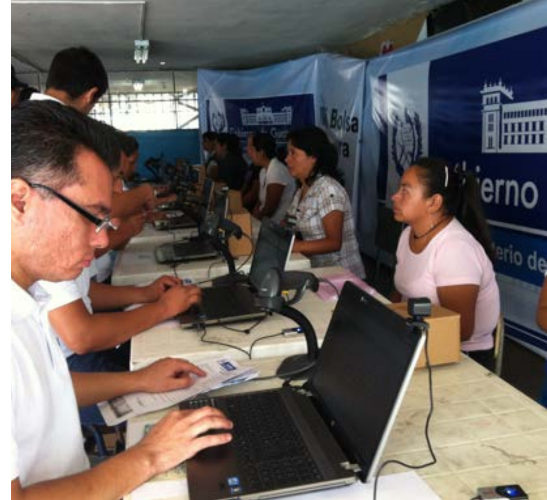
Sistema de Registro Usuarios y Entrega de Bolsa A cada Usuario se le registra su huella dactilar, una foto con tecnología de reconocimiento facial y se digitaliza su cédula o DPI.

• Capacitación. Previo a la entrega se capacita a todos los Usuarios, y se vuelve esta capacitación la Corresponsabilidad para poder obtener la Bolsa Segura.