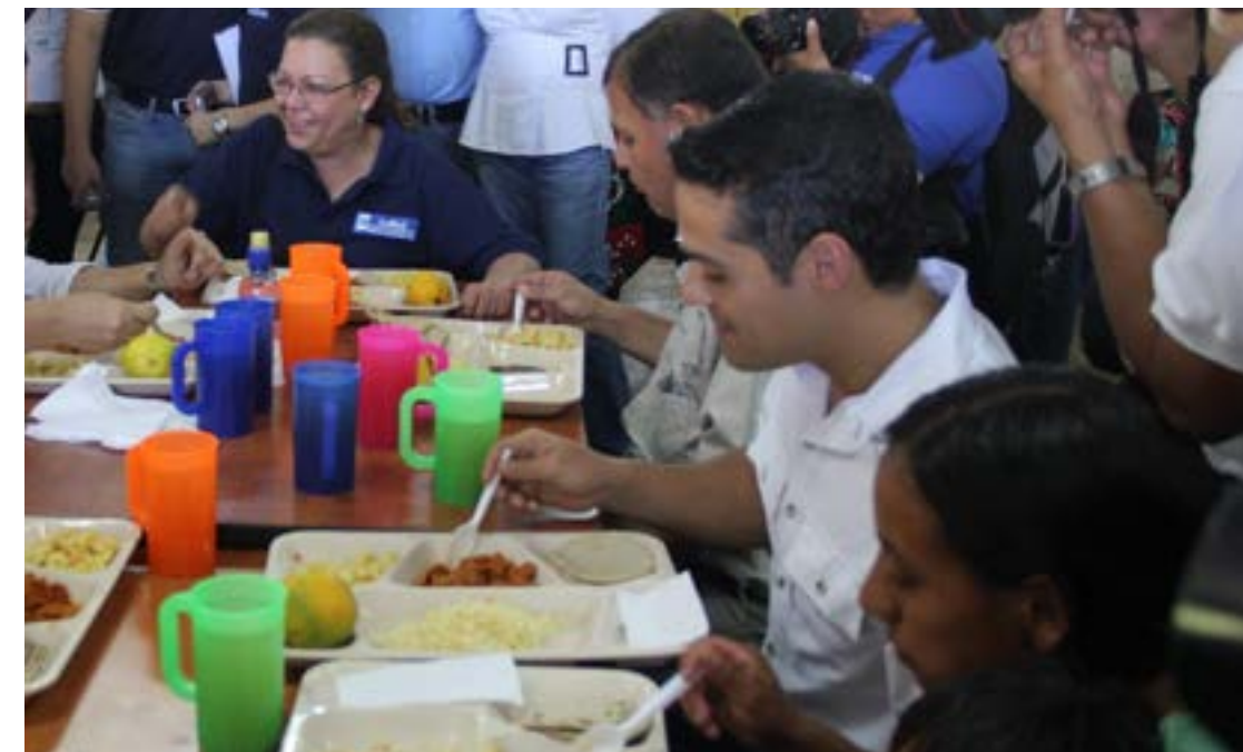
Lanzamiento del Comedor Seguro en Santa María Xalapan, Jalapa

• Transparencia. Se desarrolló un sistema en donde el Usuario registra su huella dactilar, datos generales y se le toma una foto antes de recibir su ración.